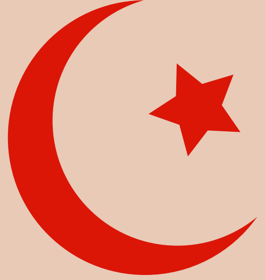
İbrahim Keskin 7-C